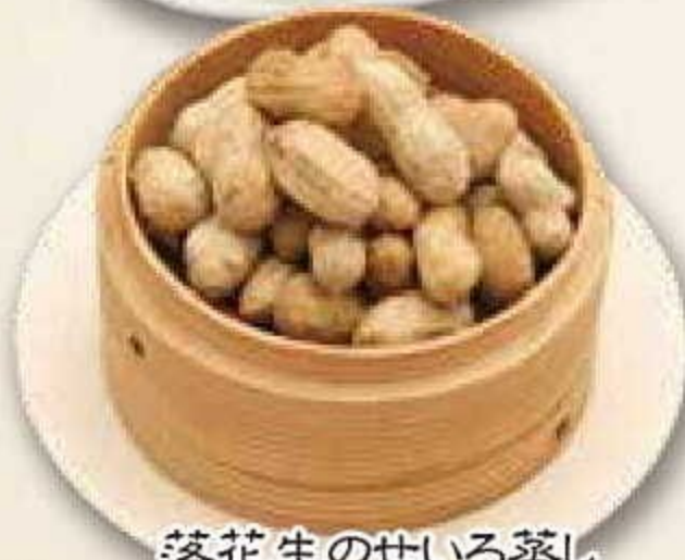
落花生のせいろ蒸し