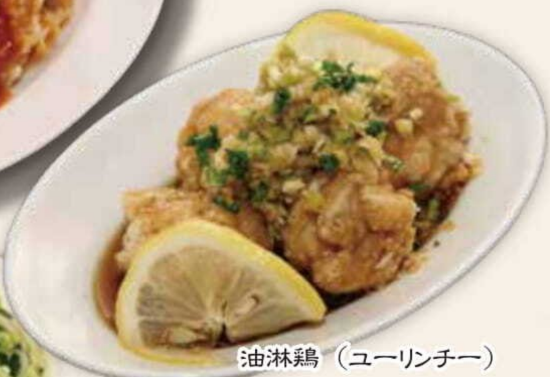
油淋鶏 (ユーリンチー)