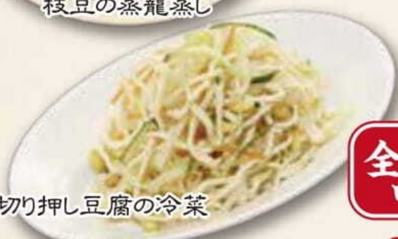
糸切り押し豆腐の冷菜