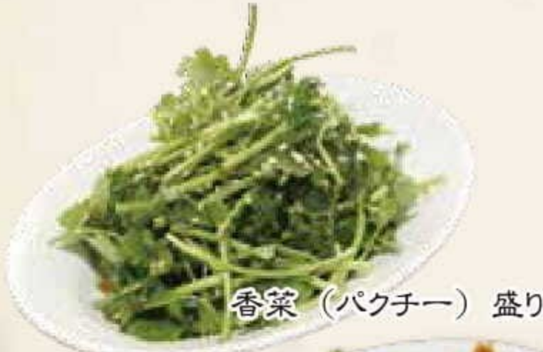
香菜（パクチー）盛り