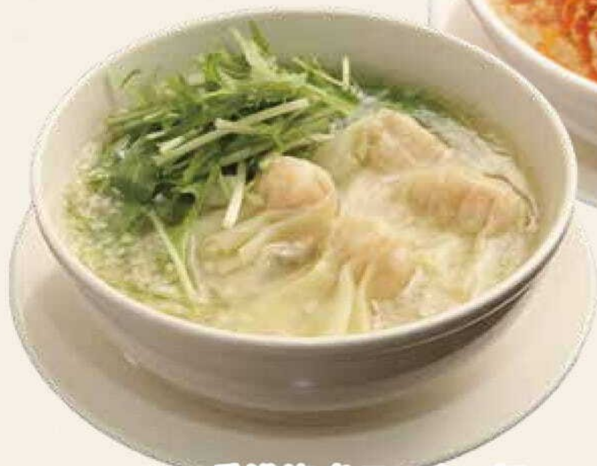
香港海老ワンタン麵