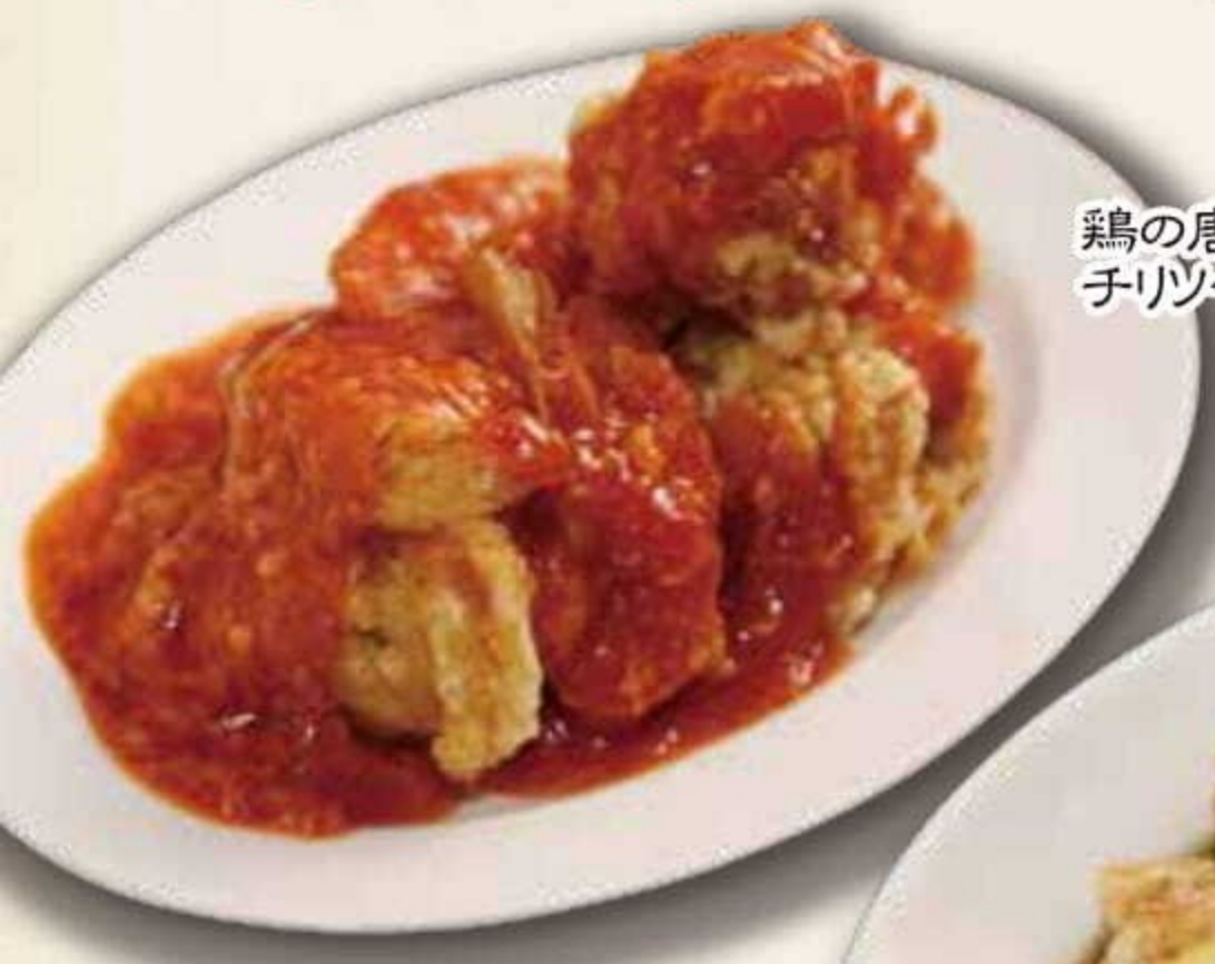
鶏の唐揚げ チリソースがけ